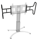
Zwei große, stabile Griffe