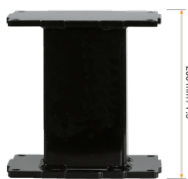
Extender für Aluminiumhubsäulen