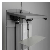
Zubehör Ablage zur Montage an der Säule - "Rednerpult-S"