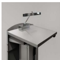
Zubehör Rednerpult - "LED-Bilderleuchte"