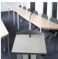
Zubehör Rednerpult - "LED-Schwanenhalsleuchte"