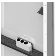
Zubehör - "3fach Steckdosenleiste, 5 m Kabel abnehmbar"