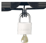
Halterungen und Flügelschloss