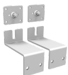
2 verzinkte Wandhalterungen