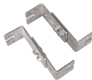
Montagesatz aus verstellbaren Wandhalterungen