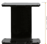
Extender für Aluminiumhubsäulen