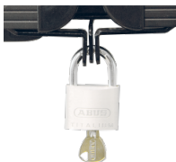
Halterungen und Flügelverschluss