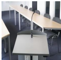
Zubehör Rednerpult - "LED- Schwanenhalsleuchte"